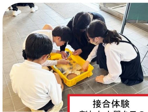
接合体験 -割れた土器を元の形に戻す体験-

※写真のお仕事のほかに、注記体験(土器に出土した場所や日付などを書き込む)ができます。