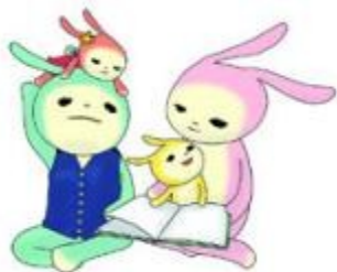
うさ本ファミリー